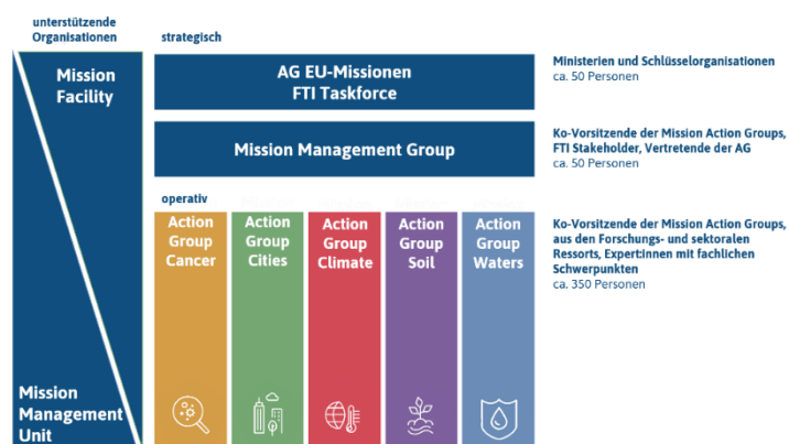
Überblick über die Governancestrukturen der nationalen Umsetzung der EU-Missionen in Österreich

Zur nationalen Umsetzung der Missionsziele hat die Mission Action Group (MAG) Climate die dafür notwendigen Initiativen diskutiert. Sie agiert im Rahmen der nationalen Governance, die vom BMBWF konzipiert wurde. Als übergeordnete Gremien wurden die Mission Management Group und die Forschung, Technologie und Innovation (FTI)-Task Force Arbeitsgruppe „EU-Missionen“ eingerichtet. Die Mission Management Unit unterstützt die Ressorts und die MAG Climate bei ihrer Arbeit und die Mission Facility übernimmt das Monitoring der Umsetzung der Aktionspläne. Die bestehende Grafik bietet einen Überblick über diese Struktur. Ziel ist es, alle relevanten Stakeholder zu diesem Thema in geeigneter Form einzubinden.