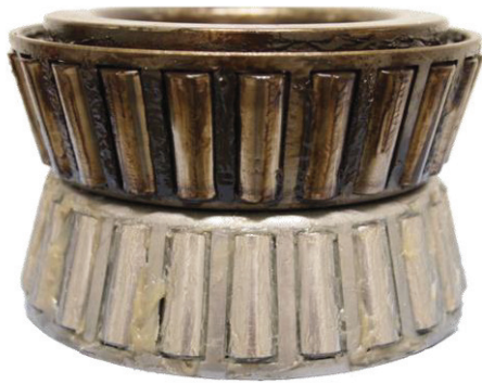
Abb. 2: Geschädigtes Lager durch Verkokung des Schmierfetts (oben) und neues fettgeschmiertes Lager (unter Bildhälfte)