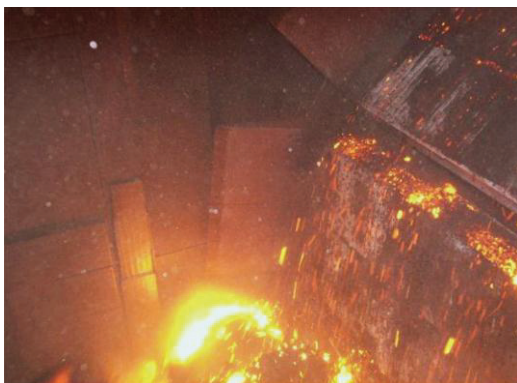
Abb. 1: Sinterrostwagen (rechts im Bild) im Einsatz

Die Stahlindustrie ist ein volkswirtschaftlich bedeutender Faktor in Europa. Um eine konkurrenzfähige Produktion auch am Standort Österreich sicherzustellen, ist ein effizienter und wartungsarmer Betrieb der Anlagen unerlässlich.