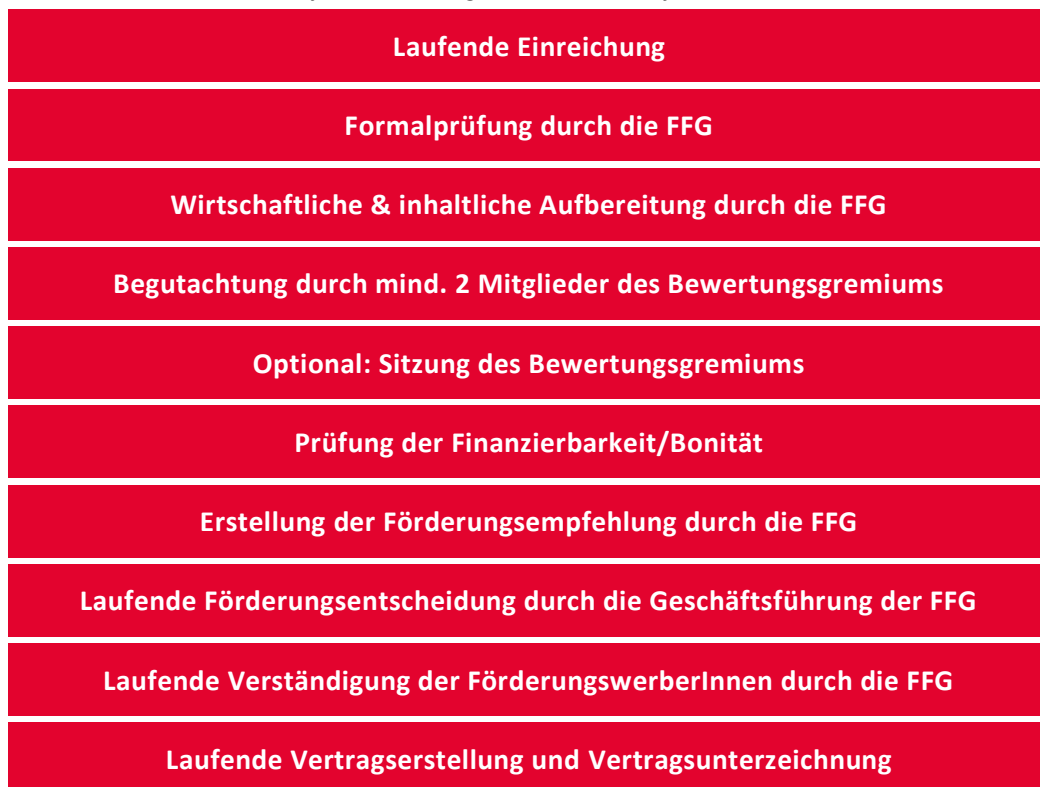
Tabelle 2: Schematischer Ablauf des Bewertungs- und Auswahlverfahrens

Folgende Grafik stellt den Ablauf des Bewertungs- und Auswahlverfahrens dar.