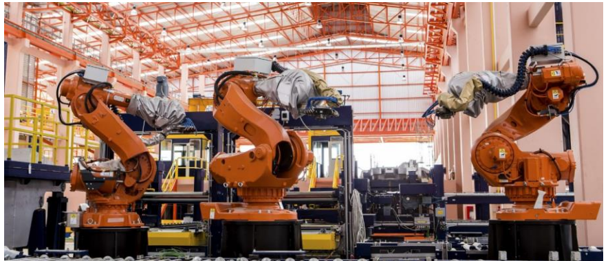
Industriesoftware muss sicher sein

Projekttyp: StraSE (Strategic Software Engineering) 2019-2022, strategisch