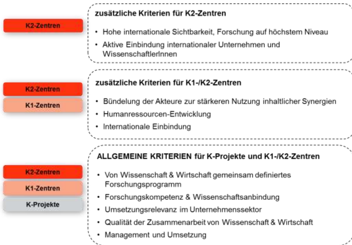
Tab.1 Übersicht der Kriterien nach Programmlinien